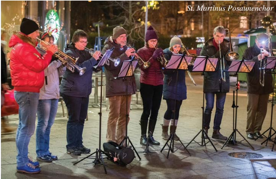
St. Martinus Posaunenchor