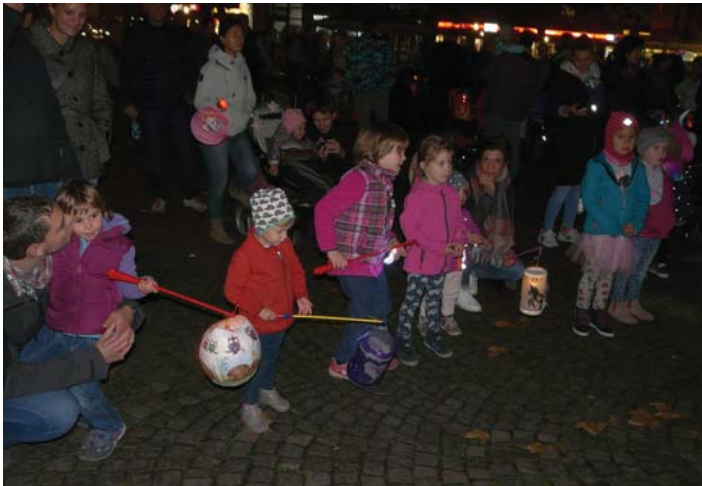
Laternenkinder auf dem Winterhuder Marktplatz