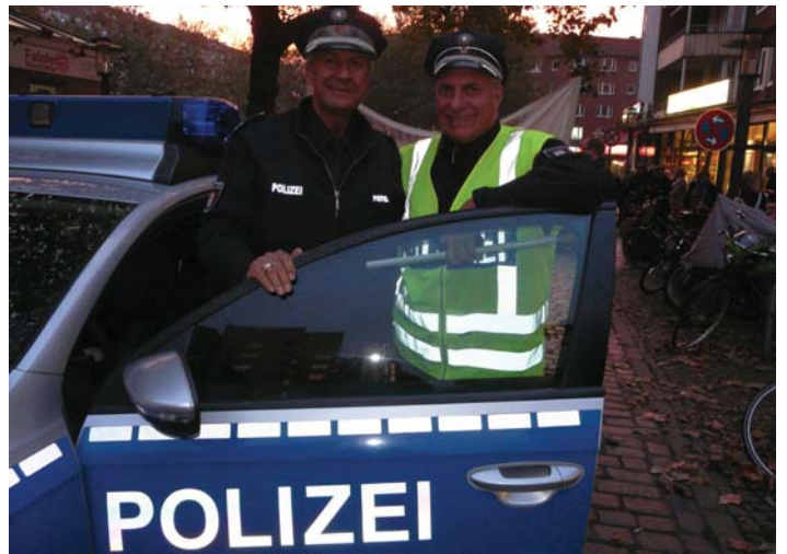
Polizisten helfen beim Laternenumzug des WBV

Für ein besonderes Highlight haben auch die Geschäftsleute rund um den Winterhuder Marktplatz gesorgt. Sie sorgten zu Beginn und am Ende für den wärmenden Tee. Vor allem aber organisierten sie vorher eine sehr erfolgreiche Aktion, in der die Kinder ihre Laternen selbst basteln konnten. Eine Super Aktion. Der Winterhuder Bürgerverein dankt allen, die zu diesem tollen Ereignis beigetragen haben und der Bezirksversammlung Hamburg-Nord, die die Aktion unterstützt hat.