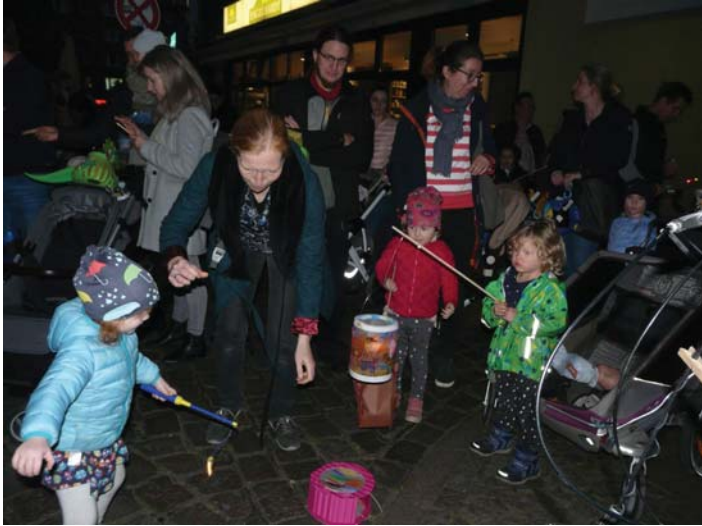
Laternelaufen mit dem WBV, Kinder mit Laternen auf dem Winterhuder Marktplatz

Er ist einer der Höhepunkte des Jahres – der alljährliche Laternenumzug des Winterhuder Bürgervereins. Diesmal konnte der WBV besonderes viele Teilnehmer begrüßen. Rund 500 große und kleine Leute zogen mit strahlenden Gesichtern vom Winterhuder Marktplatz in Richtung Ohlsdorfer Straße und dann durch die vielen kleinen Straßen in Winterhude. Dem Zug voran ging das Banner des WBV. Der Hinschenfelder Spielmannzug war wieder dabei und gab dem Zug die richtige musikalische Begleitung. Viel Freude bereitete auch, dass einige Anwohner den Zug mit Laternen vom Balkon begrüßten. Das tolle Wetter und die leuchtenden Herbstblätter taten ein Übriges, um für gute Stimmung zu sorgen.