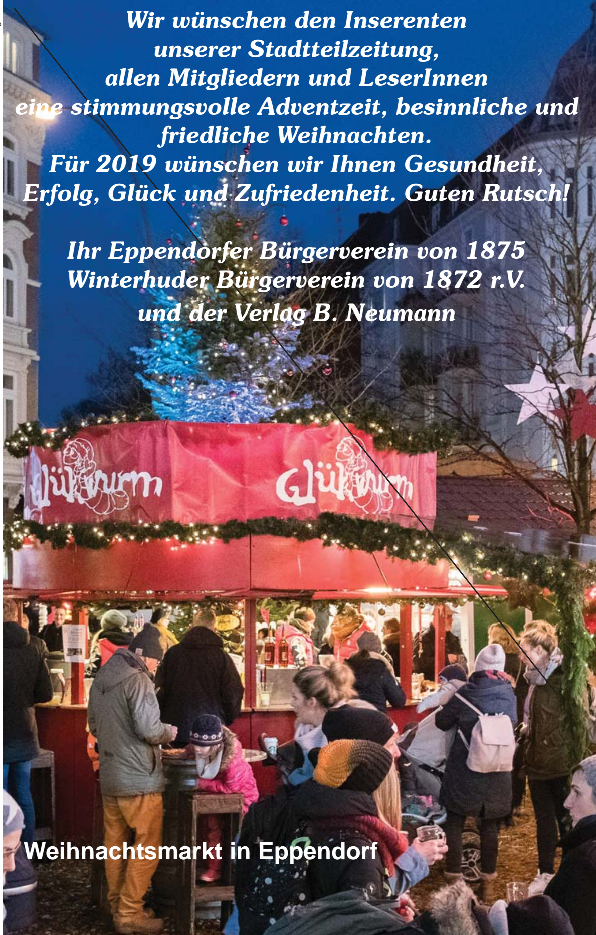
Weihnachtsmarkt in Eppendorf

Ihr Eppendorfer Bürgerverein von 1875 Winterhuder Bürgerverein von 1872 r.V. und der Verlag B. Neumann