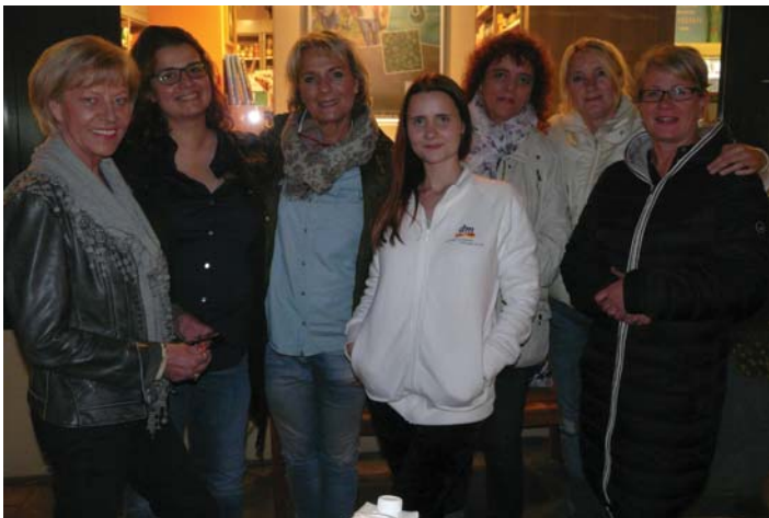
Gewerbetreibende von Winterhude