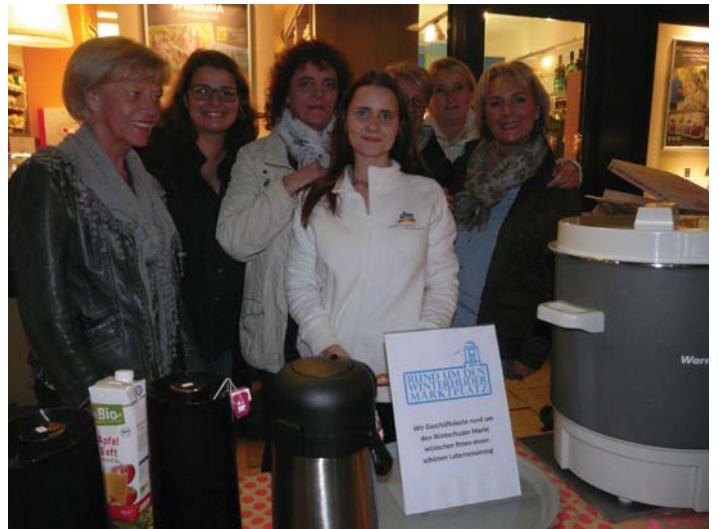
Glühweinausschank durch Gewerbetreibende aus Winterhude